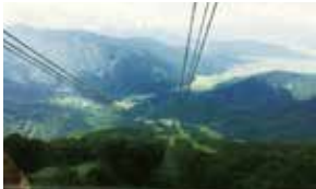
○[2日目] 八海山ロープウェイ