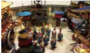
○[3日目] おしゃざり会館